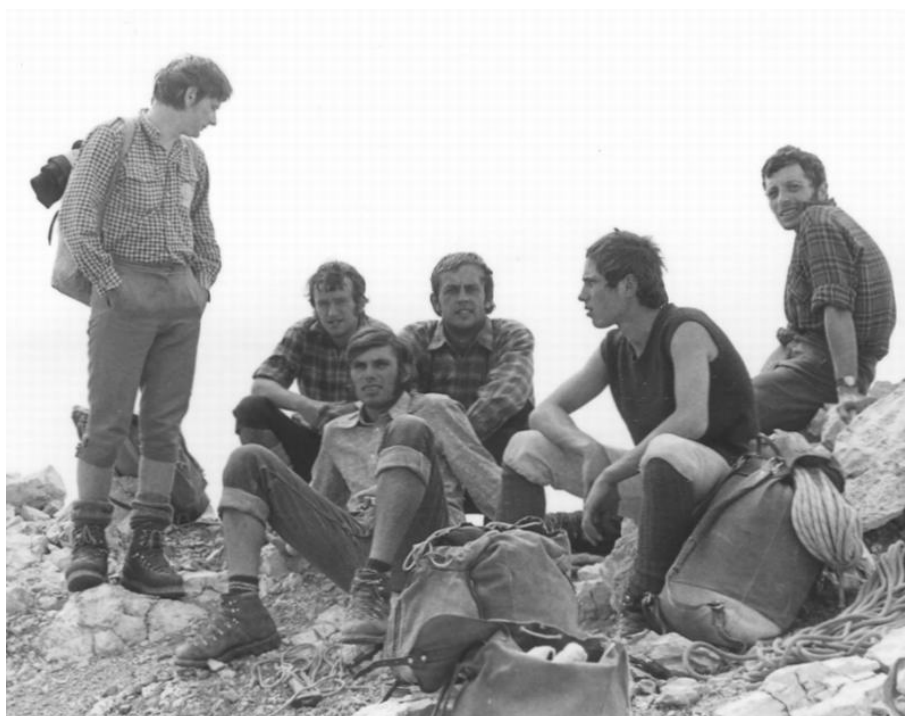
Škrlatica, 8. 8. 1972