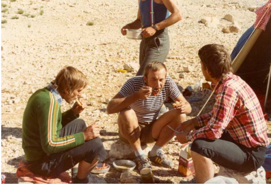
Taurus, 1977 [?]