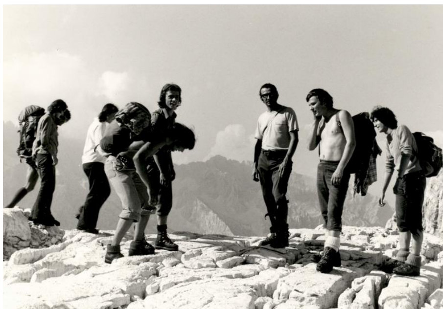
Tabor v Vratih, avgust 1974 [D. Kavnik]