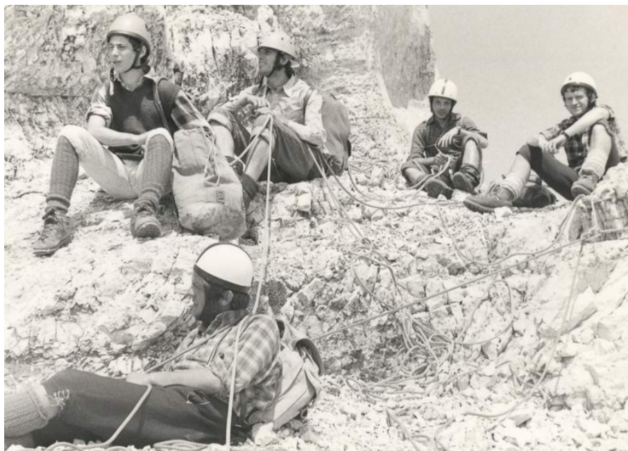
Škrlatica, 8. 8. 1972