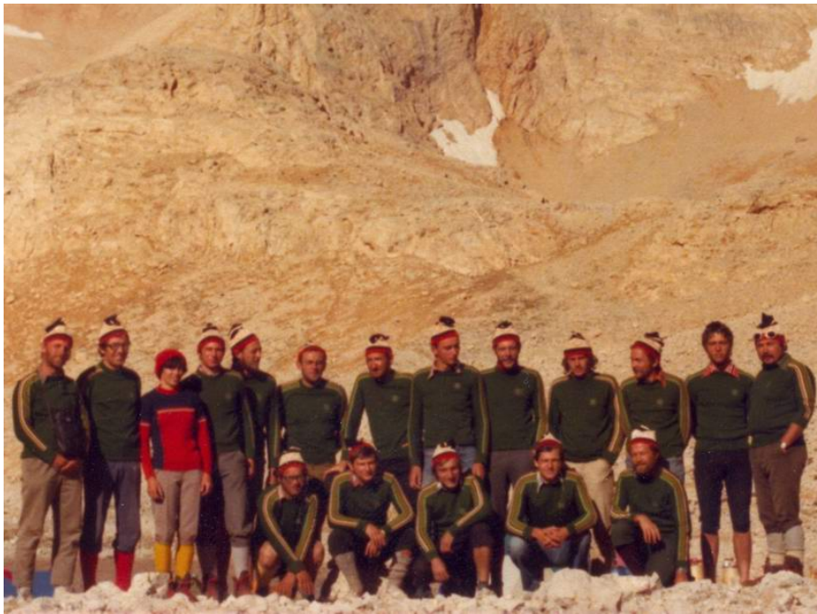
Taurus, 1977