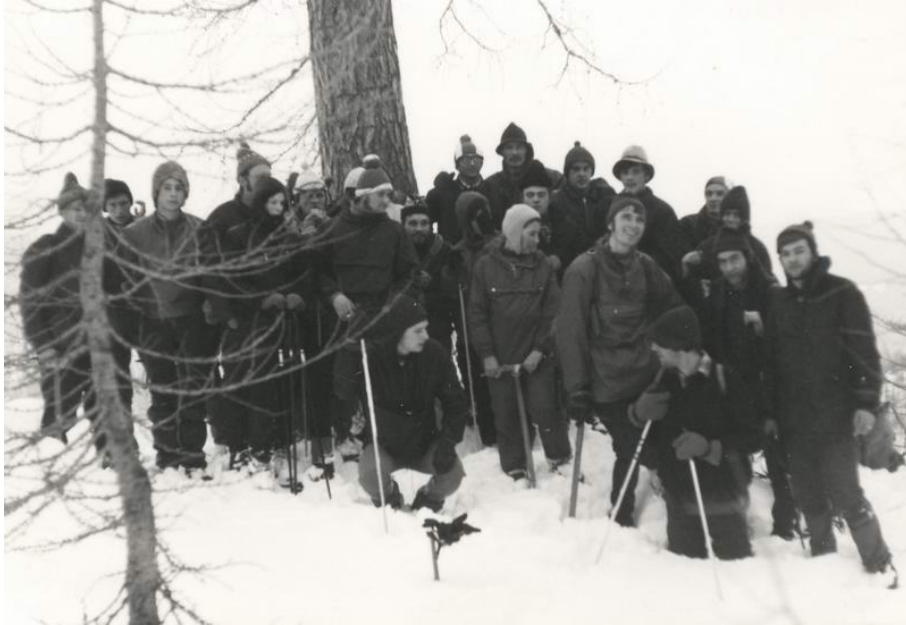
Klemenškova planina, 29. 11. 1972