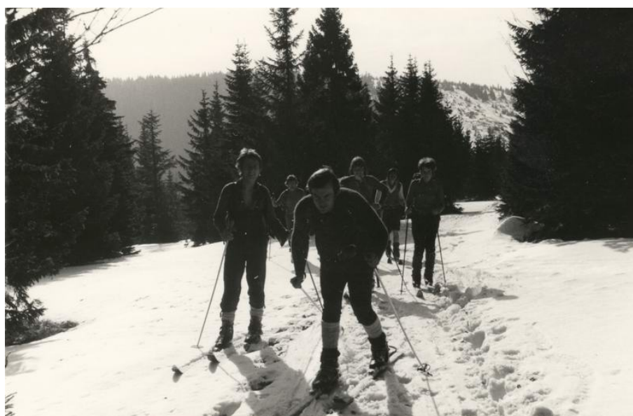
S smučmi čez Pohorje, januar 1975 [D. Kavnik]