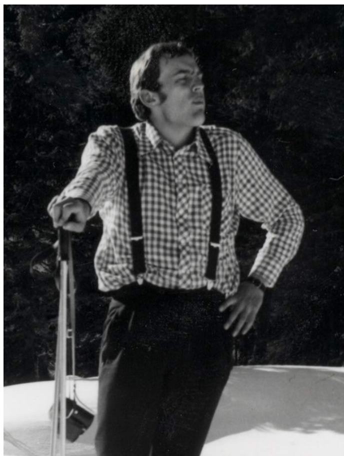
S smučmi čez Pohorje, januar 1975 [D. Kavnik]