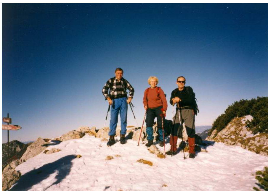
Na Durcah, december 2004

Z nahrbtnikom na ramenih sem se počutila svobodno. Visoke smreke so mi šepetale: "Pridi večkrat, saj vidimo, da si v gorah srečna." V mislih sem jim odgovarjala, da mi tišina v mogočnih krošnjah krepi duha, prinaša mir v moje srce, ki si še vedno želi ljubezni.