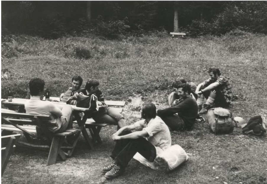
Tabor v Krnici, 6. 8. 1972