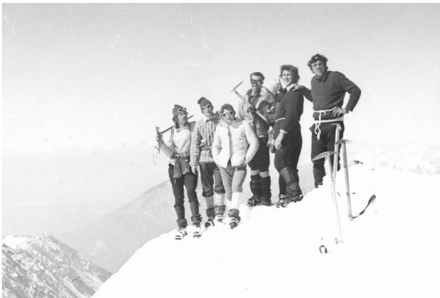
Na vrhu Storžiča, marec 1973