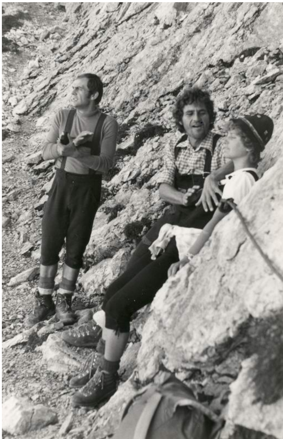
Mangart, avgust 1979