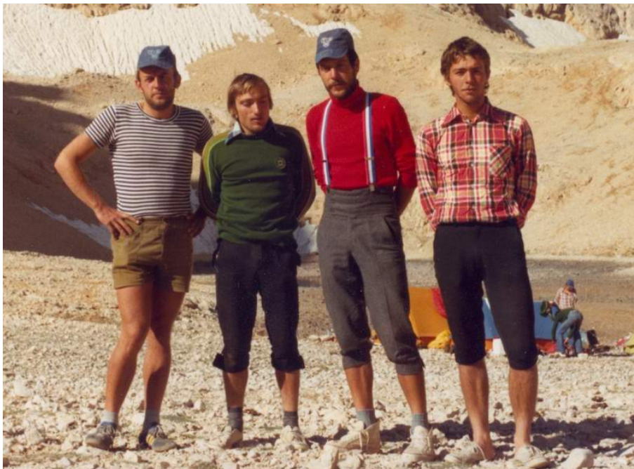
Taurus, 1977