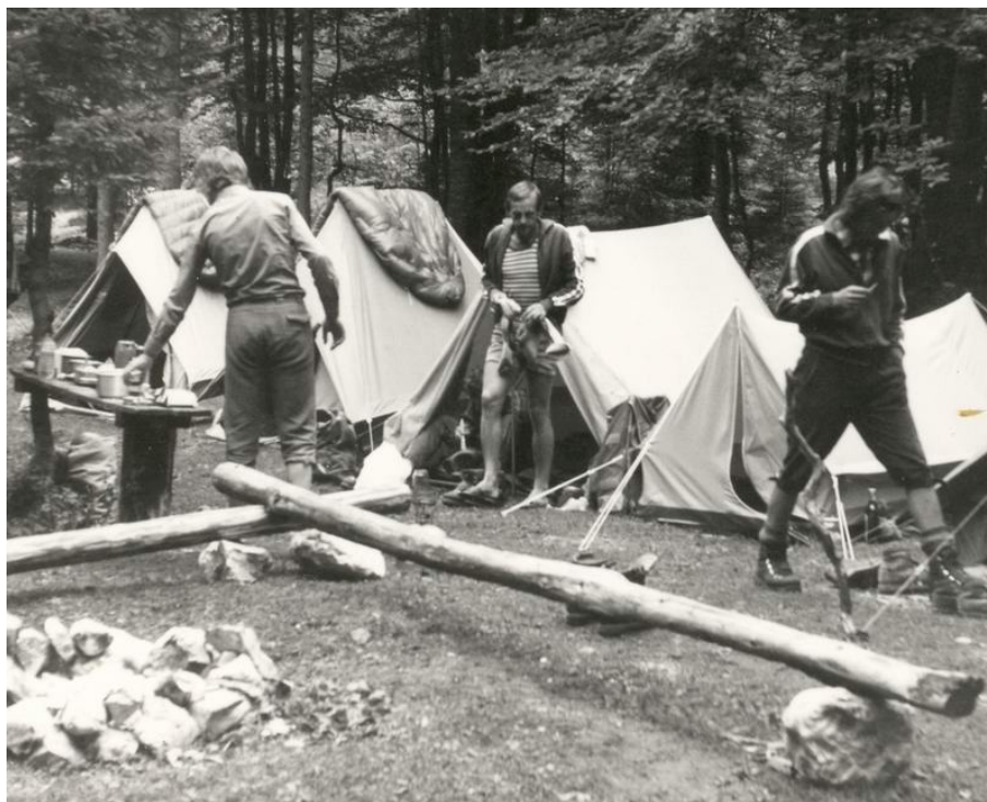
Tabor v Vratih, avgust 1974 [D. Kavnik]